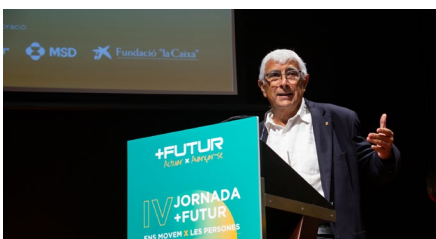
Vídeo de cloenda del Conseller