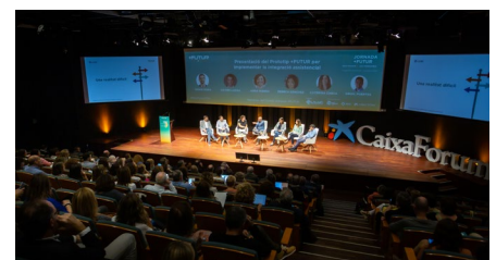
Continguts de la IV Jornada +Futur Superem barreres: implementem